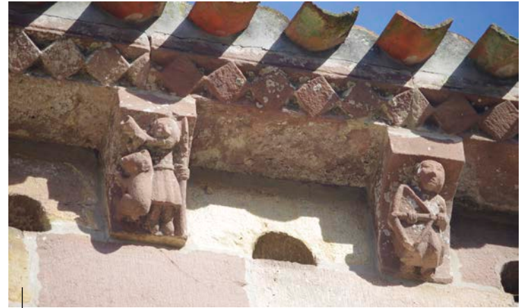
Dei-adar jolearen irudikapena. Santa Maria elizako hagaburutxo. Yermo (Kantabria). XIII. mendea

Representación de un bocinero. Arco de la iglesia de Santa María la Mayor. Uncastillo (Navarra). Siglo XIII