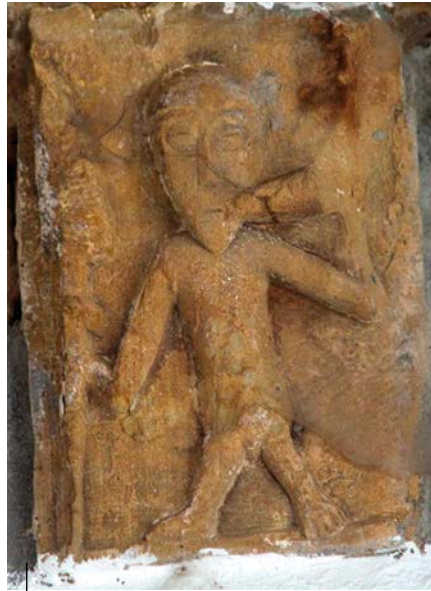
Dei-adar jolearen irudikapena. Ugarteko San Bizente elizako hagaburutxoak. Muxika (Bizkaia). Erromanikoa.

Representación de un bocinero. Canecillos de la iglesia de San Vicente de Ugarte. Muxika (Bizkaia). Románico.