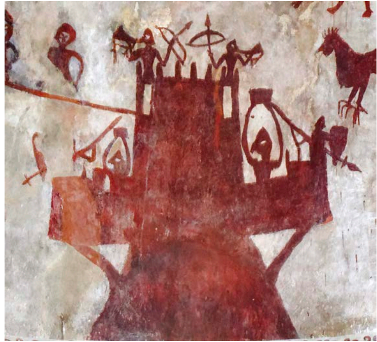
Dei-adar jolearen irudikapena. Jasokundeko Andre Mariaren elizako kapitela. Ahedo de Butron (Burgos). XIII. mendea Representación de bocinero. Capitel de la iglesia de Nuestra Señora de la Asunción. Ahedo de Butrón (Burgos). Siglo XIII