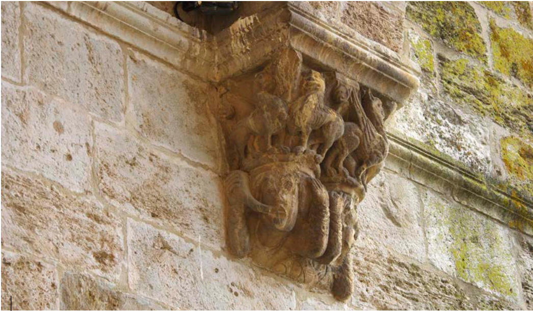
Dei-adar jolearen irudikapena. Iratxeko Santa Maria la Real monasterioko mensula. Aiegi (Nafarroa). Erromanikoa.

Representación de un bocinero. Ménsula del monasterio de Santa María la Real de Iratxe. Aiegi (Navarra). Románico.