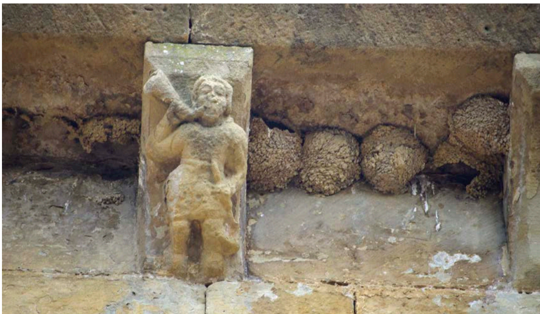
Dei-adar jolearen irudikapena. San Migel Arkanjeluaren elizako hagaburutxo. Biota (Zaragoza). XIII. Mendea

Representación de bocinero. Canecillo de la iglesia de San Miguel Arcángel. Biota (Zaragoza). Siglo XIII