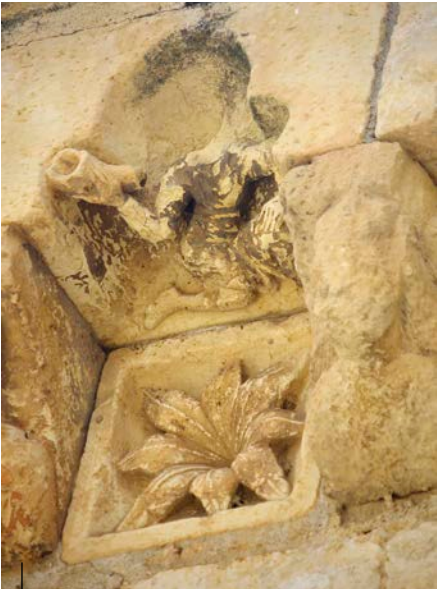
Dei-adar jolearen irudikapena. San Miguel elizaren xehetasuna. Sotosalbos (Segovia). XIII. mendea Representación de un bocinero. Detalle de la iglesia de San Miguel. Sotosalbos (Segovia). Siglo XIII