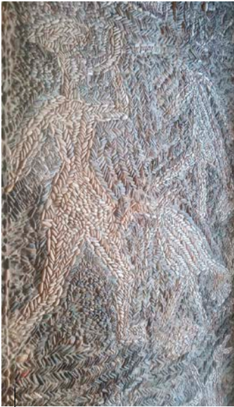
Ehiza-eszena baten barruan Dei-adar jolearen irudikapena. Villamayor de los Monteseke (Burgos) Santa María la Real klaustroko zoru harriztatua. XVI. mendea

Representación de un bocinero dentro de una escena de caza. Suelo empedrado del claustro de Santa María la Real de Villamayor de los Montes (Burgos). Siglo XVI