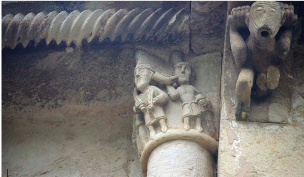
Dei-adar jolearen irudikapena. Tejadako San Pedro elizako kapitela. Puente Arenas. Valle de Valdivielso (Burgos). XIII. mendea Representación de un bocinero. Capitel de la iglesia de San Pedro de Tejada. Puente Arenas. Valle de Valdivielso (Burgos). Siglo XIII

Azkenik, esan beharra dago lan honen bitartez erakutsi nahi izan dugula Bizkaiko tradizio hori zein zaharra den, gutxienez XIV. mendera baikaramatza. Lehen garaietatik sinbolo bihurturik, haren oroimena ez zen erabat ezabatu erabilera XV. mendearen amaiera aldean murriztu bazen ere. Horri esker, idazle asko aritu ziren dei-adarren erabilerak eta aspaldiko garaiekiko loturak azaltzeko ahaleginetan. Azalpen eta hausnarketa horien poderioz, aberastu egin zen tradizioa —Bizkaiko kondairekin nahastu zen—, askotan bizkaitar berezitasunen (legeak, kultura, hizkuntza...) iraupenaren aldeko borroka-inguruabarrean. Baina eraldatu ere egin zen, harik eta XIX. mendean gaizki ulertu zen arte. Orduantxe izendatu ziren lehenengoz ustezko bost dei-adar mendiak. Horrek eskutik ekarri zuen jatorrizko errealitatea aldatzea, baina baita Bizkaian antzinatik erroterik dagoen tradizioa berreskuratzea eta gaur egunera arte iristea ere.