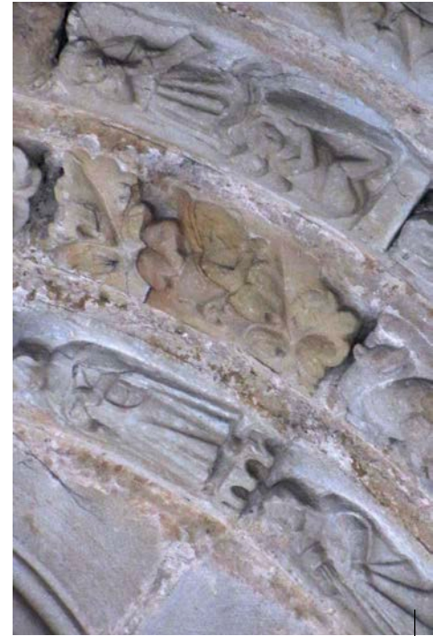
Dei-adar jolearen irudikapena. Andre Maria eliza. Galdakao (Bizkaia). XIII-XIV. mendea

Representación de un bocinero. Arco de la iglesia de Santa María la Real. Olite (Navarra). Románico.