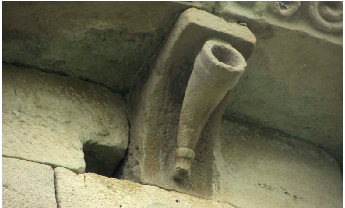
Adarraren irudikapena. San Martin elizako hagaburutxo. Artaiz (Nafarroa) Representación de bocina. Canecillo de la iglesia de San Martin. Artaiz (Navarra)

rra aipatzen duelako eta Batzar Nagusia geroago, bi ekintzak bereizirik daudela ulertzeko bidea emanik. yo el dicho doctor fize tanner las çinco bozinas segun [...] vso e costumbre de Vizcaya fize fazer Junta en Garnica (sic), asi / de las villas como de los solares como de la tierra llana, e todos / en tanto asi ayuntados so el arbol de Guernica. 30