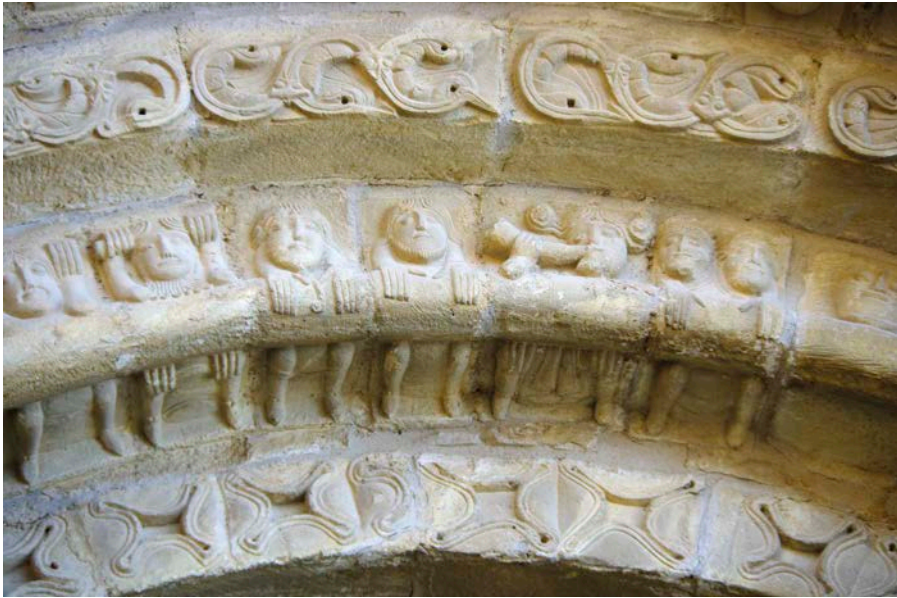
Dei-adar jolearen irudikapena. Etxanoko San Pedro elizako arku. Oloritz (Nafarroa). Erromanikoa. Representación de un bocinero. Arco de la iglesia de San Pedro de Etxano. Oloritz (Navarra). Románico.

vatalla con su victoria los vizcainos cumplieron lo contratado e prometido a este ynfante, e de su propia boluntad le reziuieron por Señor, e porque era rubio rojo llamáronle Don Zuria, e pusieron con él sus capitulaciones 85