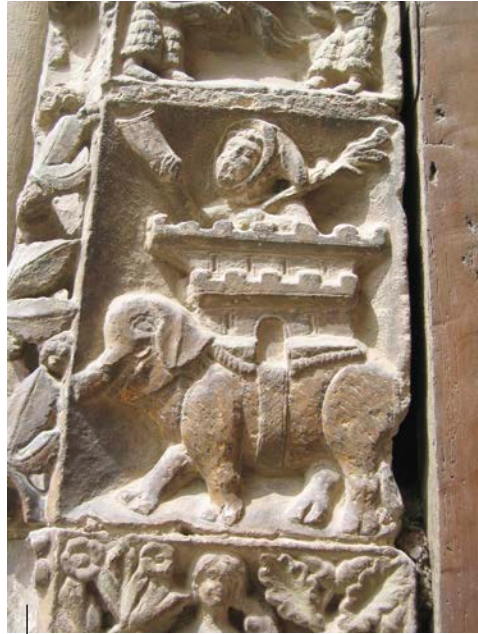
Dei-adar jolearen irudikapena. Santa María la Real elizako arku. Erriberri (Nafarroa). Erromanikoa.

Representación de un bocinero. Arco de la iglesia de San Esteban. Ullibarri-Arratzua (Álava). Siglo XIII