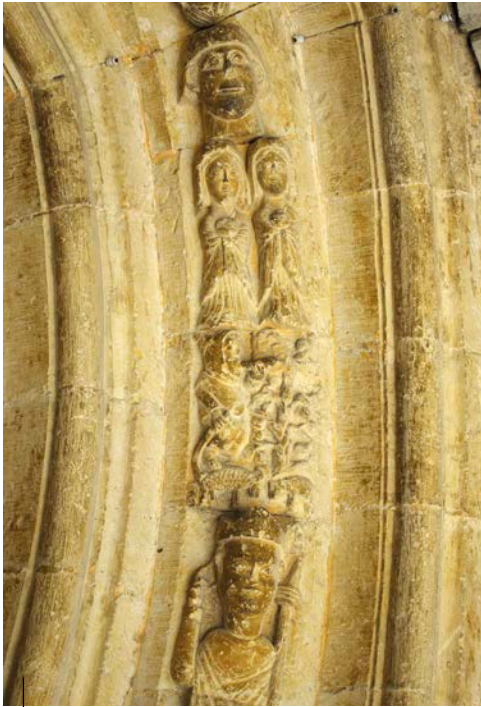
Dei-adar jolearen irudikapena. San Esteban elizako arku. Uribarri Arratzua (Araba). XIII. mendea

Representación de un bocinero. Arco de la iglesia de San Esteban. Ullibarri-Arratzua (Álava). Siglo XIII