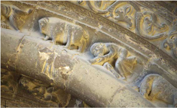
Dei-adar jolearen irudikapena. Andre Maria Nagusiaren elizako arku. Uncastillo (Nafarroa). XIII. mendea

Representación de un bocinero. Arco de la iglesia de Santa María la Mayor. Uncastillo (Navarra). Siglo XIII