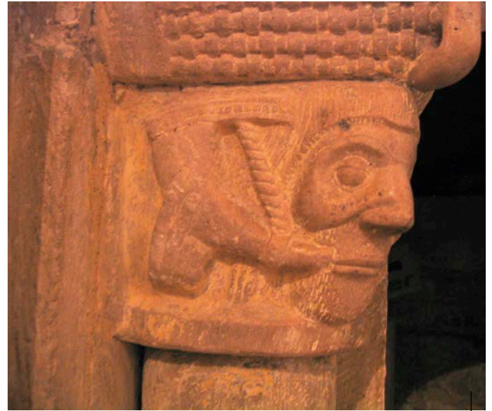
Dei-adar jolearen irudikapena. Sionesko Andre Maria elizako kapitela. Mena Harana (Burgos). XIII. mendea

Representación de un bocinero. Canecillos de la iglesia de San Vicente de Ugarte. Muxika (Bizkaia). Románico.